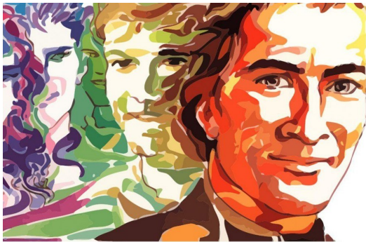
SAN MARCELINO CHAMPAGNAT