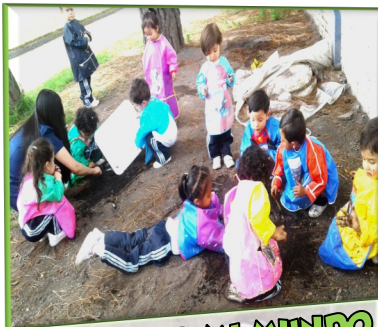
DESCUBRO MI MUNDO