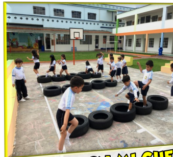
JUGANDO CON MI CUERPO