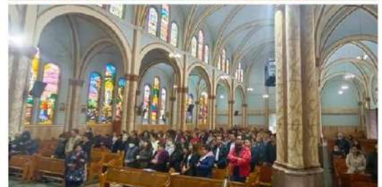
Actividades para conmemorar la Pasión y Resurrección de Nuestro Señor Jesucristo en la capilla