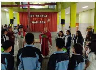
Prepascua Juvenil Marista 2023