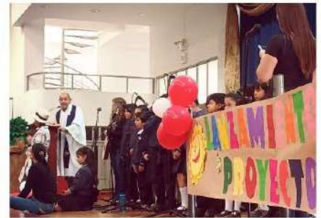
Lanzamiento del proyecto ABP