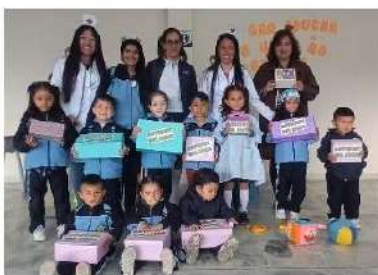
Botiquín del amor, sección preescolar